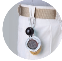
ベルトループに吊り下げて無理なく持ち歩ける!