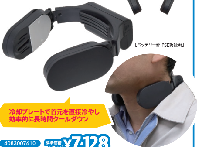
[バッテリー部 PSE認証済]