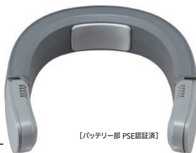
[バッテリー部 PSE認証済]