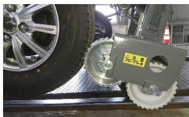
タイヤ動力で鉄輪を駆動