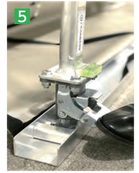
5 つっぱり棒が垂直に立っていることを確認しペダルロックを踏み込む