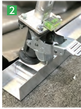
2 下部レールにつっぱり棒を設置する