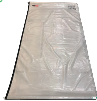
マジックシャッター1800 +上下レールL1800