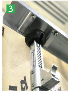
3 上部レールにつっぱり棒を設置する