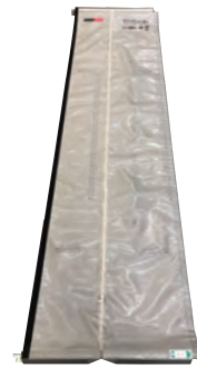
マジックシャッター900 +上下レールL900