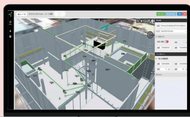
飛行アプリケーション SENSYN CORE Indoor