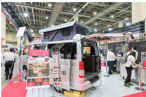
太陽光パネル搭載オフグリッドオフィスカーと Starlink Business 機材の展示の様子

山間部での作業時や高層ビル建設時などの課題であった「インターネットにつながらない」という問題を解決できる、「Starlink Business」機材を展示しました。本サービスは、オンライン会議やビデオ通話など、大容量のデータ転送が必要なシーンでも、高品質なインターネット環境を提供することができます。さらに、災害などによって通信が途切れた場合でも、「Starlink」の衛星ネットワークを活用し、ビジネスの継続や迅速な通信回復を支援することが可能です。使用シーンの一例として、太陽光パネル搭載オフグリッドオフィスカーと組み合わせて展示しました。