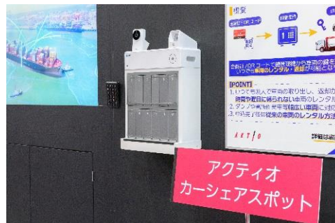
無人レンタカー貸出・返却サービス アクティオ カーシェアスポット「アクスポ」の サービス紹介の様子