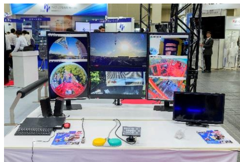
「TawaRemo®」の操作画面の展示