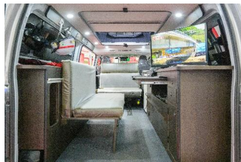
太陽光パネル搭載オフグリッドオフィスカーの 車内の様子