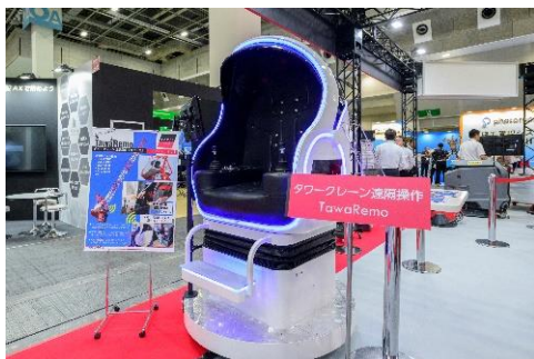
タワークレーン遠隔操作「TawaRemo®」のコックピット

竹中工務店、鹿島建設、アクティオが共同開発をしたタワークレーンの遠隔操作が可能な「TawaRemo®(タワリモ)」を展示しました。従来、長時間拘束され、かつ、ビルと同じ高さにある運転席まで梯子を使って昇降する必要がありましたが、本商品を使用することでオペレーターの人員確保や安全に寄与することが期待されています。