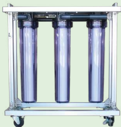
前処理フィルターユニット