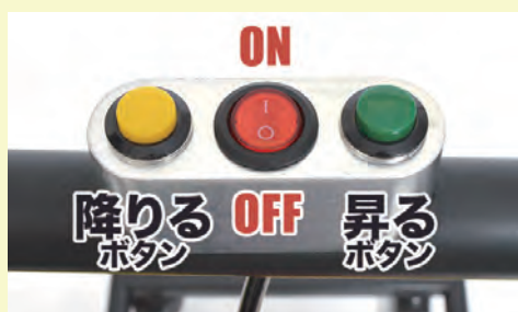
ボタン式の簡単操作