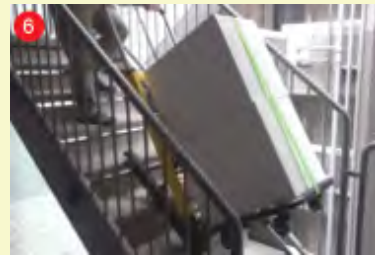
6 「昇る」ボタンで走行開始