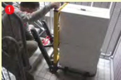
1 階段に合わせて走行ベルトの角度を調整