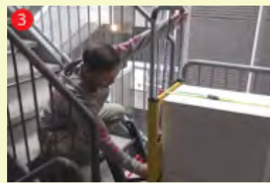
3 主電源を ON