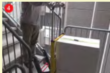
4 コントローラーの電源を ON