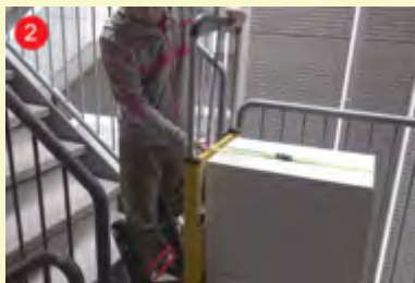
2 身長・荷物重心を加味してハンドルを調整