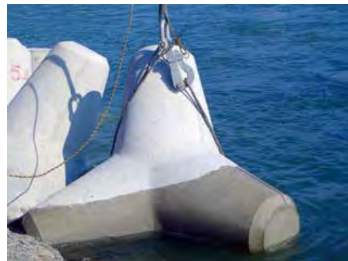
ラフタークレーンの場合、主巻・補巻に取り付ければ、クレーン操作で玉外しが可能