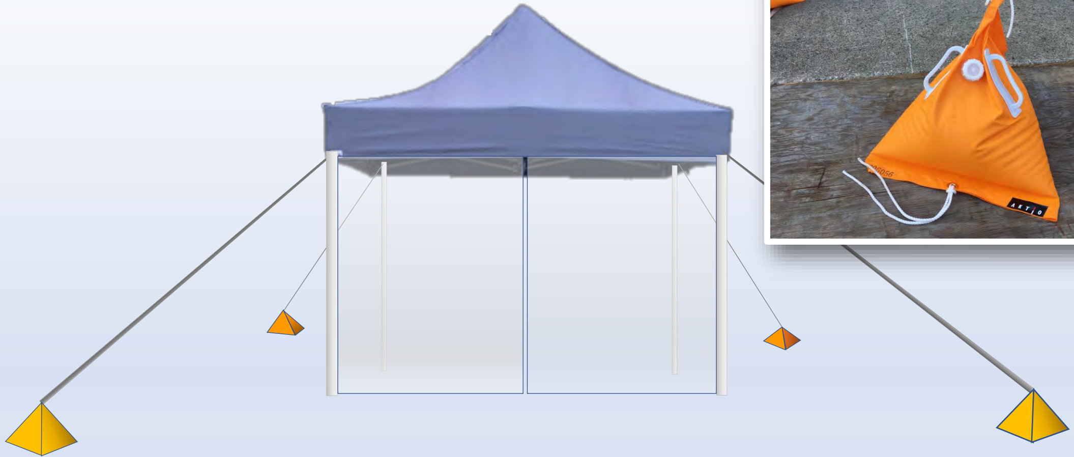
冷える一む使用例