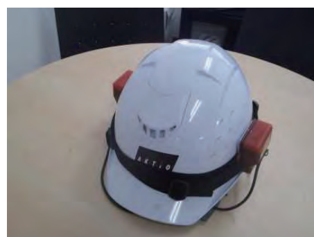
ヘルメットセンサー