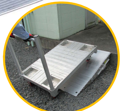
運搬台車の移動に