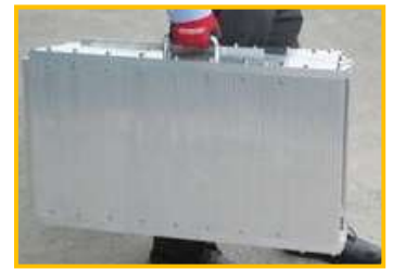
持ち運びに便利な持手付き（可倒式）