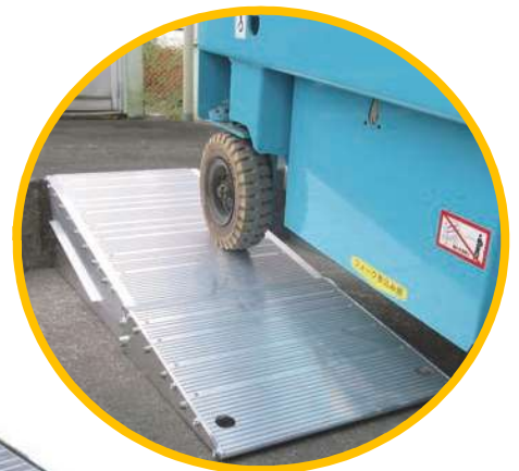
高所作業車の移動に