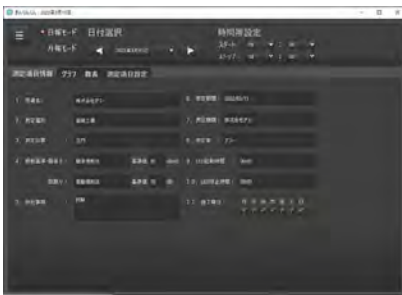
パソコン管理画面